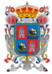
Escudo de Campeche

A la llegada de los españoles, en el siglo XVI, la península estaba dividida en 16 pequeñas entidades, llamadas en maya cuchcabal y mencionadas como "provincias" por los europeos. El primer viaje de exploración partió de Santiago de Cuba el 8 de febrero de 1517. El capitán Francisco Hernández de Córdoba con tres navíos, llegaron al pueblo maya de Can Pech, el 22 de marzo de 1517; fanáticos y obsesivos con el santoral