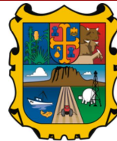
Escudo de Tamaulipas

Durante la mayor parte de la colonia la población europea sufrió los embates de las tribus indígenas rebeldes, a los que a su vez esclavizaban o asesinaban. En 1732 José de Escandón arribó al territorio y desarrolló un agresivo programa de colonización y pacificación que se extendería al vecino Nuevo Reino de León. Tras el llamado a la independencia hecho por Miguel Hidalgo y Costilla, Bernardo Gutiérrez de Lara, originario de Revilla (hoy Nva, Cd, Guerrero, Tam.), se unió a las filas insurgentes y obtuvo importantes victorias en San Antonio Bejar (hoy San Antonio, Texas). El 17