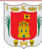
Escudo de Tlaxcala