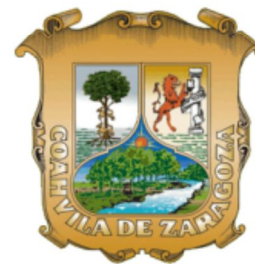
Escudo de Coahuila