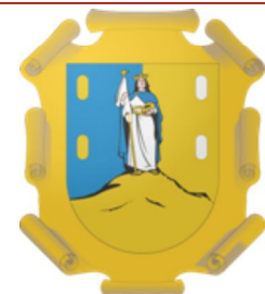
Escudo de San Luis de Potosí